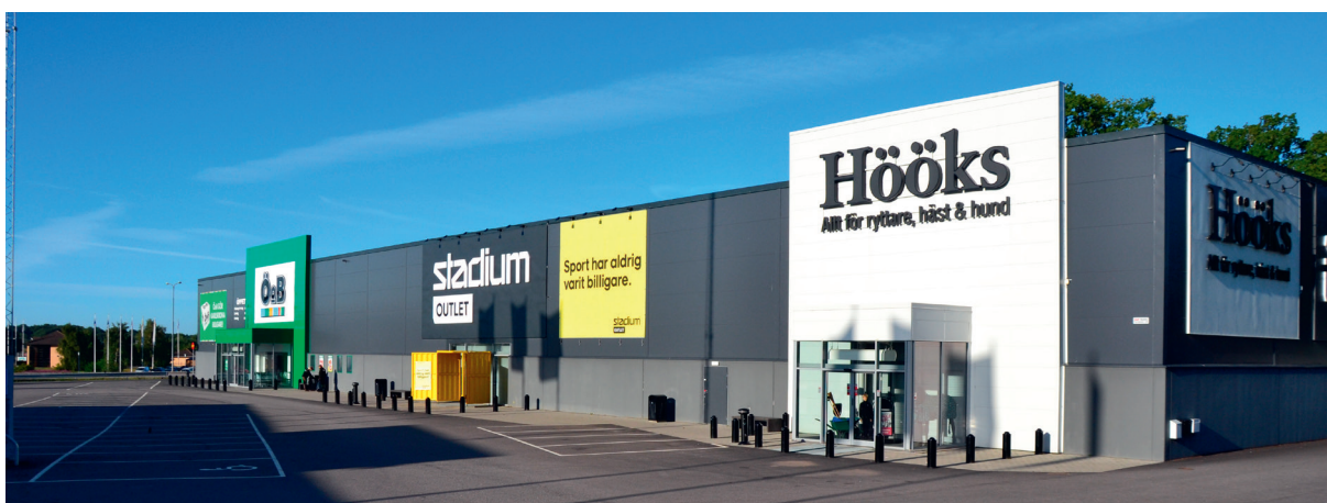
Stadsträdgården Vedeby, Karlskrona