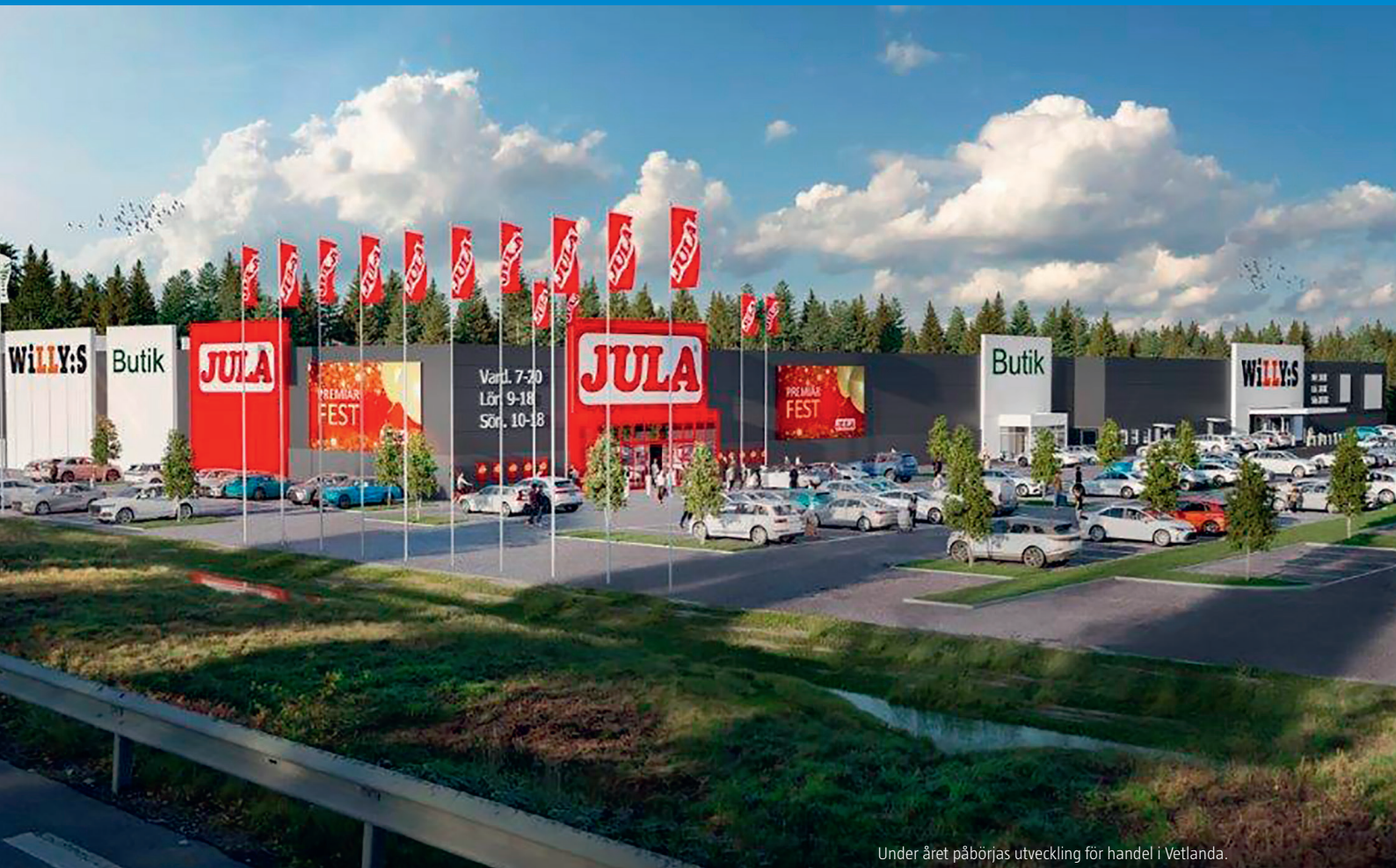
Under året påbörjas utveckling för handel i Vetlanda.