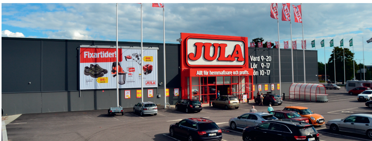
Stadsträdgården Vedeby, Karlskrona