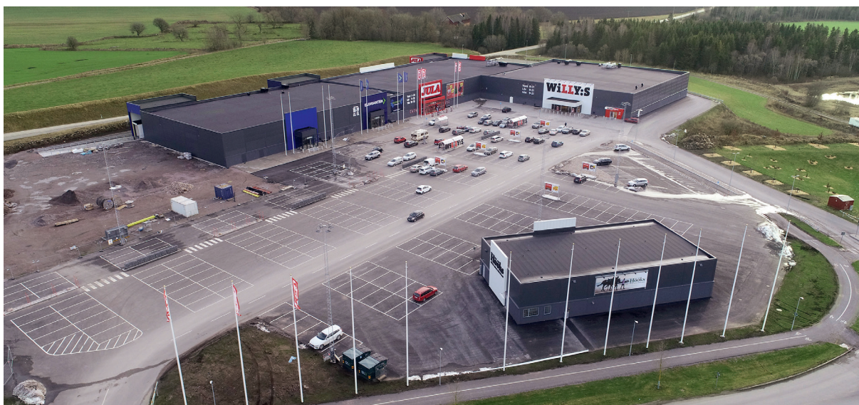
Ällebergs center, Falköping