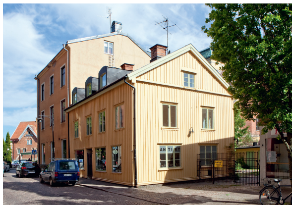
Sparbanken 22, Skara