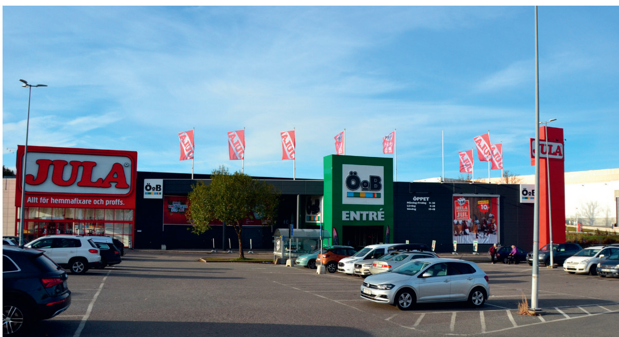
Kungens Kurva, Huddinge