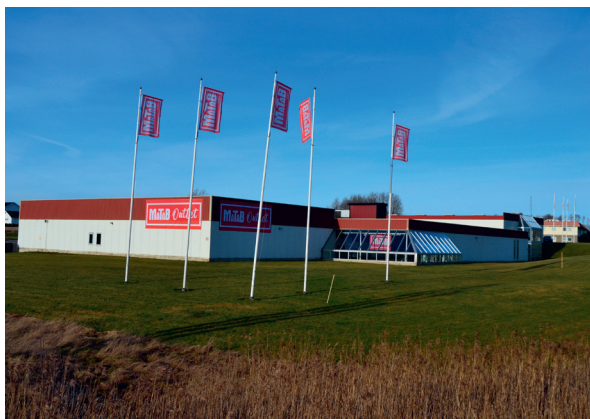
Ladan 3, Skara